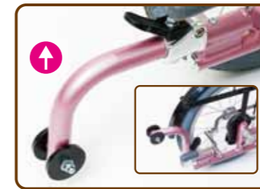
跳ね上げ式転倒防止用装置