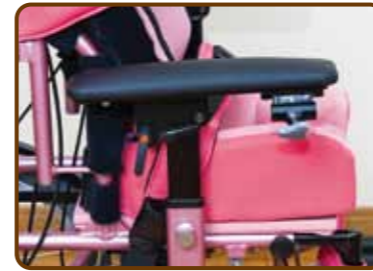
高さ&角度調整式アームサポート