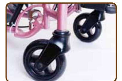
屋外用キャスター