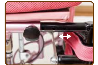
座奥行き調整機構