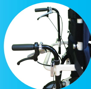
高さ調整式手押しハンドル