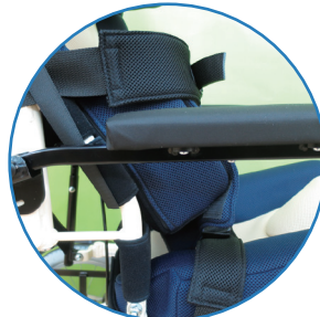
アームサポート (跳ね上げ機構付き)