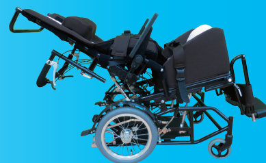
ティルト & リクライニング仕様 (エレベータリングは特別オプションです)