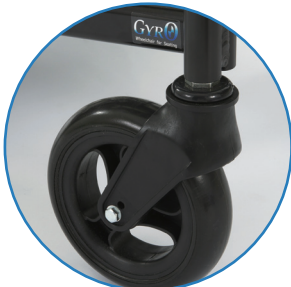
屋外用キャスター