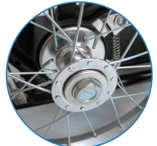
介助者用ブレーキ

製造元：日進医療器株式会社 本 社：〒481-8681 愛知県北名古屋市沖村権現35-2 TEL. 0568-21-0635(代表) FAX. 0568-23-2787