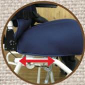
座奥行き 前後調整