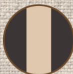
チャコール ダークベージュ