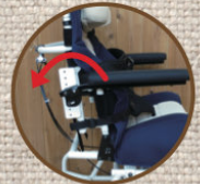
背座両面角 角度調整