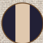
ネイビー ダークベージュ