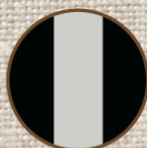
ブラック ライトグレー