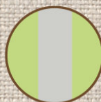
ミントグリーン ライトグレー